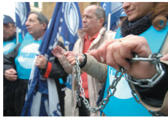
INCATENATI La manifestazione dei Pensionati

dei Pensionati era a TeleLombardia a dare informazioni sul partito, si accettavano telefonate. Tutti i cittadini hanno avuto accesso immediato, Berlusconi l'hanno fatto aspettare in linea, «hanno chiesto addirittura al proprietario della Tv se potevano passarmelo». «Pronto sono Berlusconi, volevo chiederle come mai avete appoggiato Prodi visto che io ho fatto tanto per i pensionati». Fatuzzo non ha fatto una piega: «Perché è vero, lei ha fatto molto, come portare a un milione di vec-