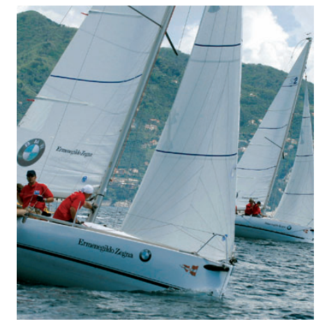
IN REGATA Il trofeo Zegna lascia Portofino