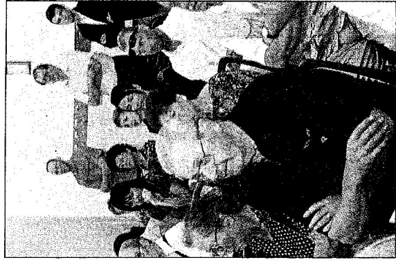
Assemblea sul problema delle emissioni

L'ultimatum scade a ottobre: entro tale data lo stabilimento dovrà dotarsi delle migliori tecnologie