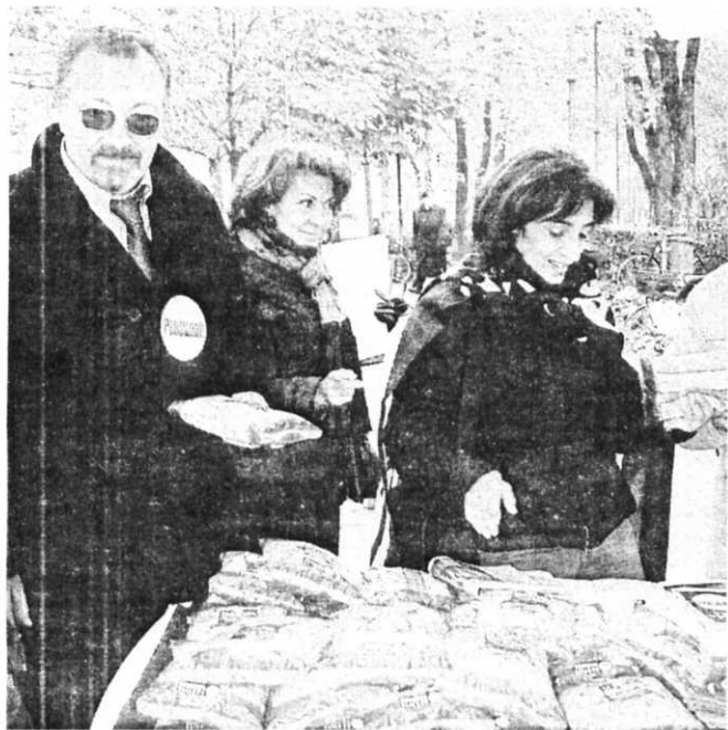
Il presidio ieri mattina del partito dei Pensionati